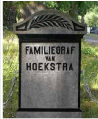
Een mooie combinatie van schoonmaken en schilderwerk. De steen staat op het graf van een oude moeder en twee jonggestorven dochters. Graf 03-565