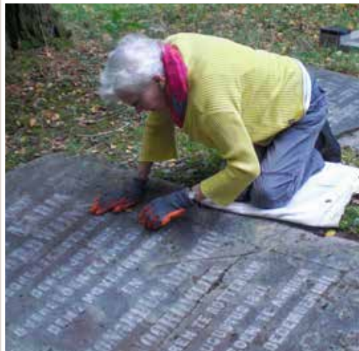
Noordwijns graf 02-223. Een schoonmaakbeurt maakt de tekst weer leesbaar.