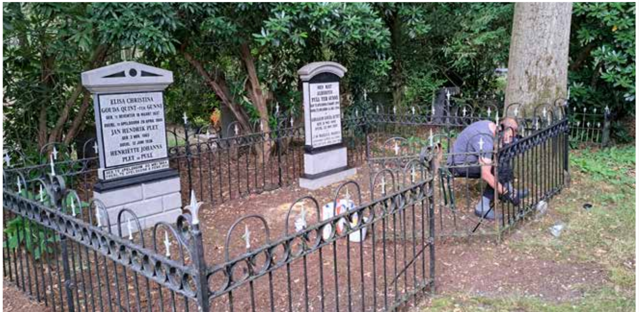
Gouda Quint graf 01-263 en Pull graf 01-264.

Vroeg 20e-eeuwse neoclassicistische graftekens met geprofileerde basementen met grote frontons. Karakteristiek smeedijzeren hekwerk rond dit ruime graf.